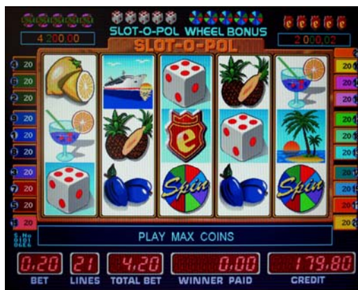
Fig.1 Slot-o-pol видеослот

-5 символов DICE (игральные кости) на активной линии включают бонус игру SLOT-O-POL BONUS. Игрок бросает кости до 7 раз.