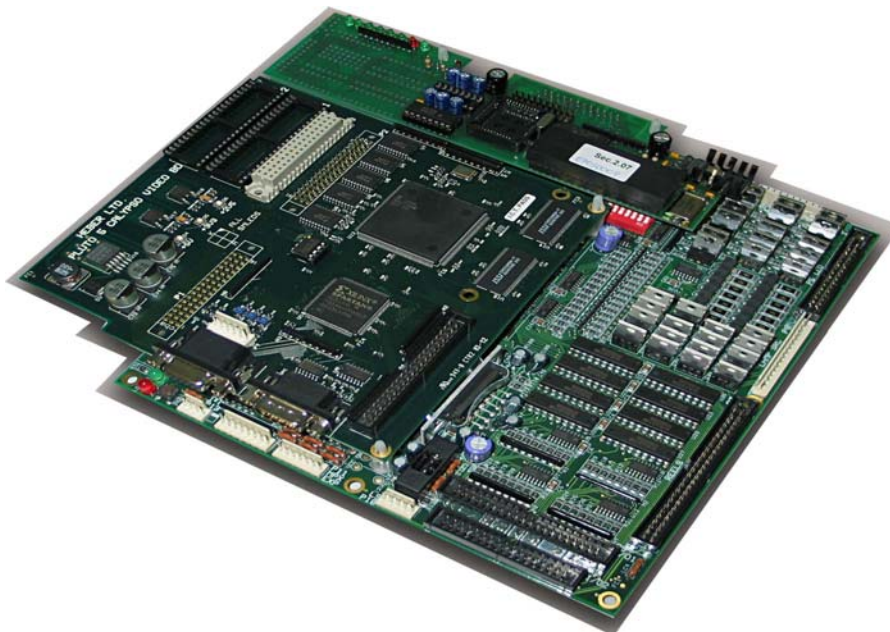
Fig. 9 – Игровая плата

Внимание! Все игровые настройки выполняются от статистических и административных меню игровой программы без использования DIP переключателей. При первоначальном подключении игровой платы или при смене программной версии необходимо выполнение процедуры начальной настройки игрового автомата, описанной в потребительском руководстве Start-up Manual.