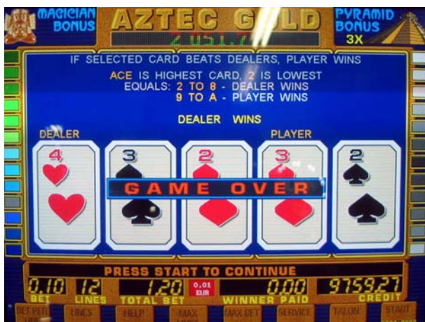
Fig.8 Примерный экран риск игры (вариант – проигрыш игрока)

Игрок может продолжать дублирование, пока не достигнет суммы выигрыша равной DOUBLE UP LIMIT, заданному в статистической настройке игры.