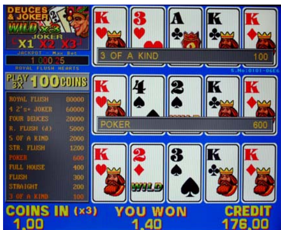
Fig.6 Примерный игровой экран для покеров MegaJack

На основном игровом экране для покеров MegaJack (Fig.6) показаны колоды карт в выбранном игроком количестве (кнопка Холд4) в правой части экрана – и игровая информация в левой части – название покера, величина текущего джекпота или максимального приза, максимальная ставка и таблица выигрышей для текущей ставки; в нижней части экрана слева направо расположены окно для текущей линейной ставки (COIN IN) x числу выбранных линий, окно текущего выигрыша (YOU WON), если такой имеется, и окно общего кредита игрока (CREDIT).