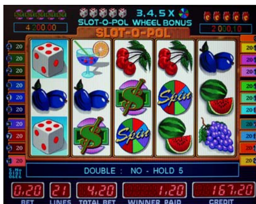
Fig.3 Slot-o-pol deluxe видеослот

-5 символов DICE (игральные кости) на активной линии включают бонус игру SLOT-O-POL BONUS. Игрок бросает кости до 7 раз.