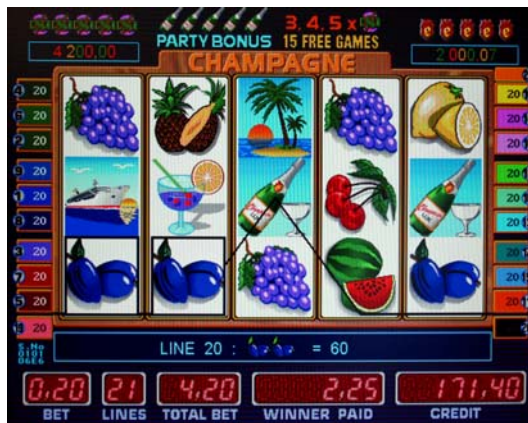
Fig.2 Champagne party видеослот