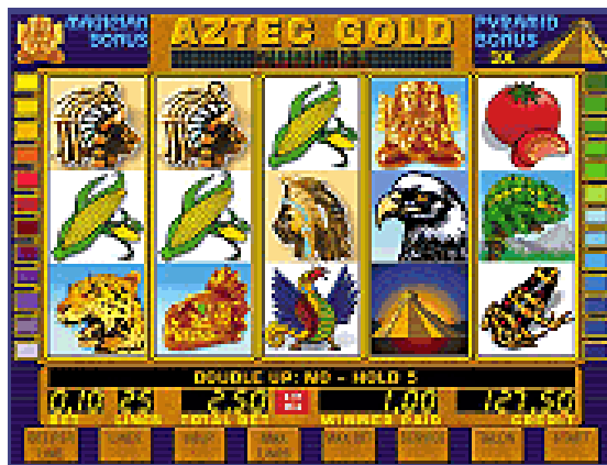
Fig.4 Примерный игровой экран для видеослота

Снизу расположены окна индикации линейной ставки, числа игровых линий, общей ставки, размера выигрыша, оставшееся количество кредитов, номинал и денежный эквивалент кредитных очков (например, 0,01 USD, 0,01 EUR и т.д.), а также лента сообщений и точки touch screen.