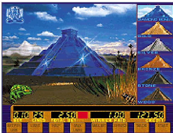
Fig.4 бонус игра Pyramid

Замечание: 1. Максимальная линейная ставка для всех игр: от 1 до 500 кредитов в зависимости от игровой настройки (см. описание административного уровня PREF). 2. Максимальный выигрыш для покеров – 80000хлинейную ставку.